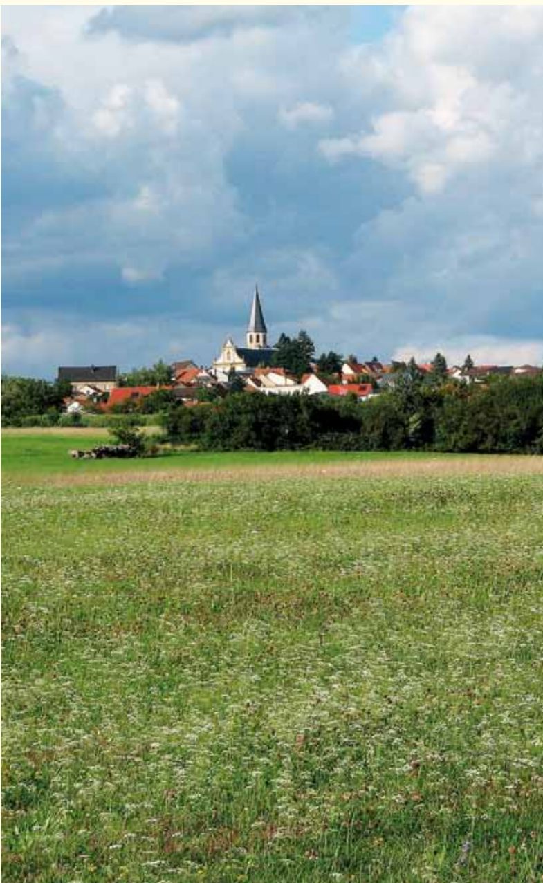
Kulturlandschaft vermittelt das Gefühl von Heimat und Identität. Oben, Flurneuordnung Malsch (Aue), Rhein-Neckar-Kreis Rechts, Flurneuordnung Sternenfels-Diefenbach, Enzkreis

Vielfalt, Eigenart und Schönheit von Natur und Landschaft für eine naturbezogene Erholung gilt es zu erhalten. Wie wichtig Naturerfahrung für die Persönlichkeitsentwicklung und die soziale Kompetenz von Kindern und Jugendlichen ist, wird durch zahlreiche wissenschaftliche Studien belegt.